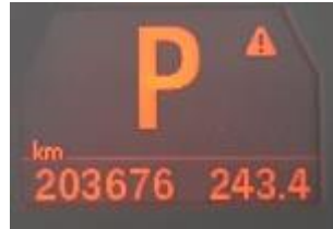
Rys. 7. Wskazanie drogomierza