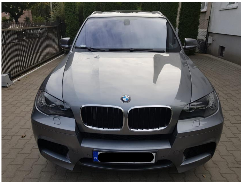
Rys. 1. Przód pojazdu

W celu przedstawienia stanu faktycznego pojazdu, który został przedmiotem wykonania opinii eksperckiej, pokazano poniżej fotografie BMW X5M E70.