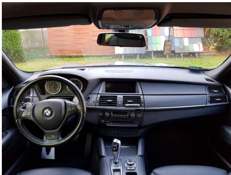
Rys. 5. Wnętrze pojazdu