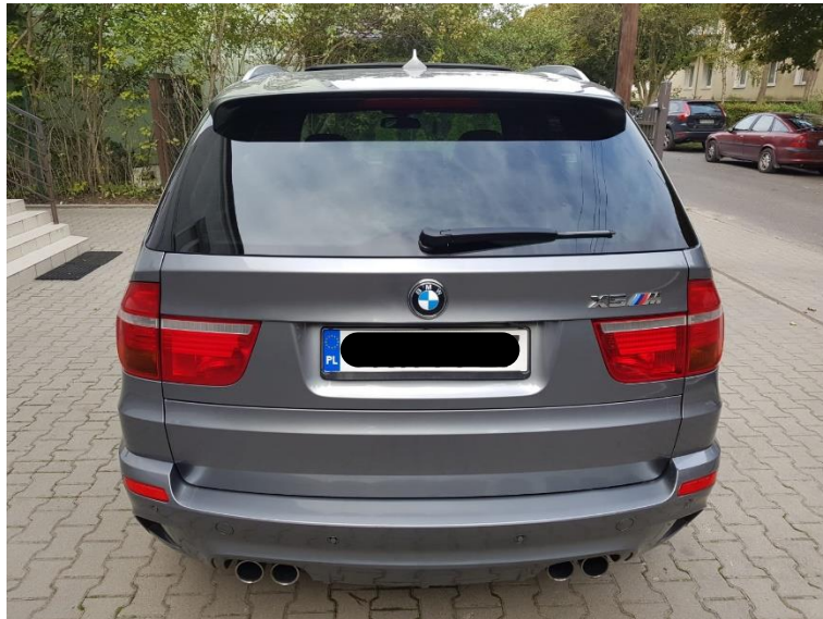
Rys. 4. Tył pojazdu