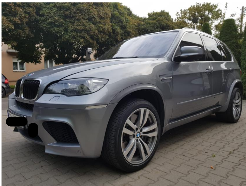
Rys. 2. Lewy bok pojazdu