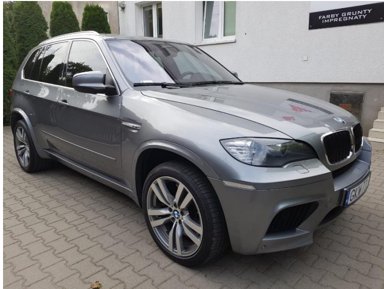
Rys. 3. Prawy bok pojazdu